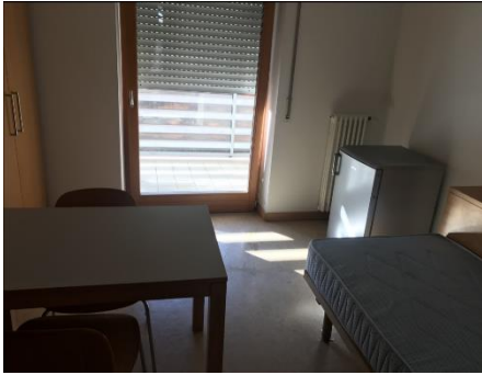
Ein Zimmer im Wohnungsheim