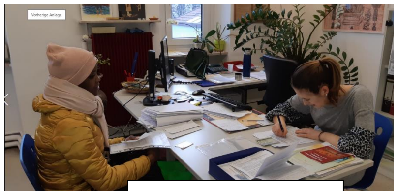
Bei der Erstellung eines Mietvertrages für ein Wohnungsheim.