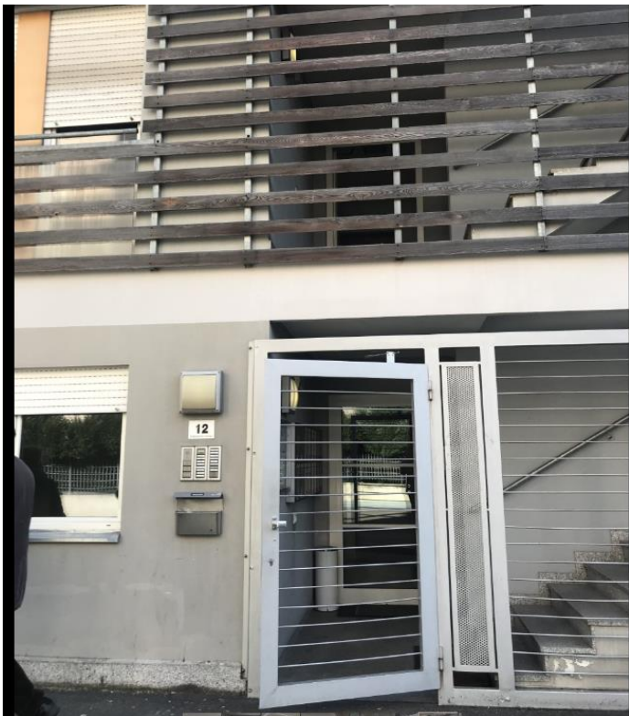
Wohnungsheim in der Pfarrhofstraße Bozen